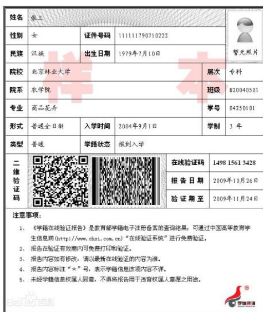
教育部学籍在线验证报告

四、高校驻地在青岛市的应届本科毕业生（含全日制成人高校应届本科毕业生）：须上传“中国高等教育学生信息网”的《教育部学籍在线验证报告》。